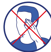
Évitez de vous toucher le visage