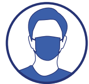
Portez un masque quand la distance d'un mètre ne peut pas être respectée et dans tous les lieux où cela est obligatoire