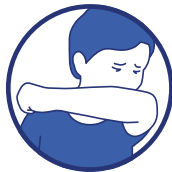
Toussez ou éternuez dans votre coude ou dans un mouchoir