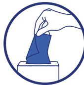
Mouchez-vous dans un mouchoir à usage unique puis jetez-le