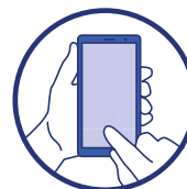
Utiliser les outils numériques (TousAntiCovid)