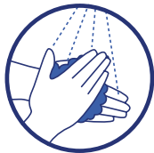
Lavez-vous régulièrement les mains ou utilisez une solution hydro-alcoolique