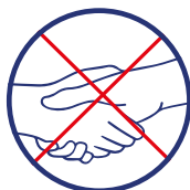
Saluez sans serrer la main et arrêtez les embrassades