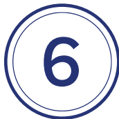
Limiter au maximum ses contacts sociaux (6 maximum)